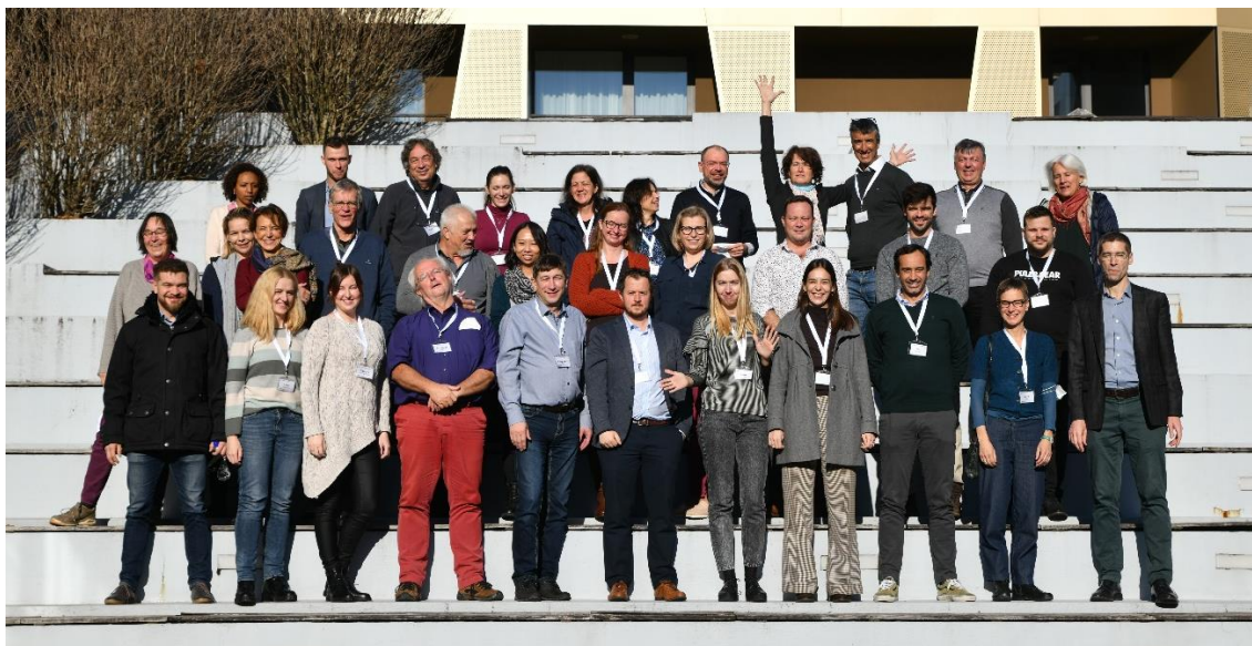
Godišnja skupština projekta održana je 6. – 7. prosinca 2021. godine u Tuheljskim Toplicama

Također, Ministarstvo poljoprivrede u sklopu i2connect projekta sudjeluje u aktivnostima povezanim s AKIS sustavom pri čemu će sva znanja i iskustva prikupljena kroz projekt biti odmah uključena u AKIS Republike Hrvatske čiji je nositelj Uprava za stručnu podršku razvoju poljoprivrede.