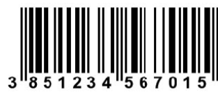
primjer GTIN oznake