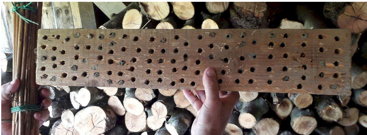
Slika 1. Izbušene rupe u staroj drvenoj gredi (9 mm) naselile su se solitarne pčele

Starinske, udomaćene vrste i sorte uzgajane u toplijim klimatima kroz godine su bile selekcionirane i oplemenjivane na niže potrebe za inaktivnim temperaturama i nisu pokazivale ili pokazuju tek manje negativne efekte uslijed zatopljenja klime, tijekom perioda mirovanja. S druge strane, novije vrste i sorte sjevernih klimata, gdje možemo svrstati i jabuku, našle su se zatopljenjem u nepovoljnom položaju za stjecanje dovoljne sume inaktivnih temperatura. Ovo se naročito događa kada ljetnim rezom bujnijih nasada izazovemo retrovegetaciju, nakon čega slijedi topla zima.