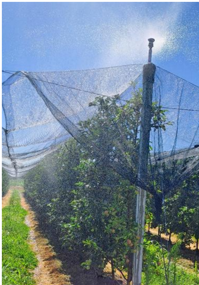
Slika 2. Hlađenje lisne površine i navodnjavanje kišenjem u nasadu jabuke, lipanj 2025.