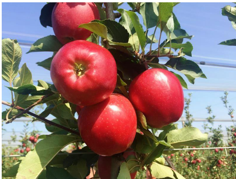
Slika 5. Gala Devil, Međimurje

Kad su niske noćne temperature gubitak šećera u pokožici ploda disanjem je mali pa ostaje više ugljikohidrata za sintezu antocijana. Tako za ne prevrućih, sunčanih dana, a hladnih noći ostaje povoljniji omjer stvaranja i potrošnje ugljikohidrata, pa više šećera ostaje u plodovima (glukoza i naročito fruktoza). Kod ranih sorata jabuke, koje dozrijevaju i beru se u vrijeme ljetnih vrućina, osobito kada su tople noći, može se očekivati i problem s količinom šećera u plodovima. Noviji podaci iz Zapadne obale SAD-a govore i o mekšim i kašastijim plodovima nakon vrućih ljeta. I kod nas sve više dolazi do problema kod berbe drugog prohoda na ranim sortama. Tijekom berbe 2024. godine, drugi prohod sorata Gala, Summerred, Red jonaprince, Crimson crisp, bio je praktično neupotrebljiv za hladnjače. Ovi podaci govore o činjenici da ćemo sve više pažnje morati usmjeriti na kvalitetu prorijede, kako bi što je veći postotak plodova završio ujednačen u prvoj klasi obrane u prvom prohodu, čime bi ujedno i smanjili trošak berbe.