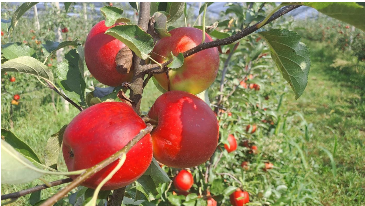
Slika 4. Crimson Crisp, Međimurje