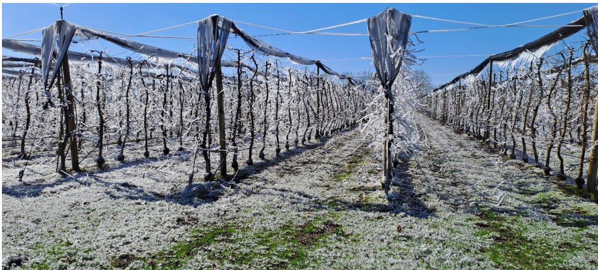
Slika 7. Antifrost sustav u radu, Međimurje

Učinak isparavanja – hlađenja kišenjem čak i kad nema mrazova može se koristiti za odgodu cvjetanja stabala jabuka u proljeće, ali nije poželjno da pupovi sadrže previše vode. Istraživanje provedeno u East Mallingu 1970-ih pokazalo je da bi se korištenjem orošavanja cvjetanje Coxovog Orange Pippina moglo odgoditi i do 14 dana.