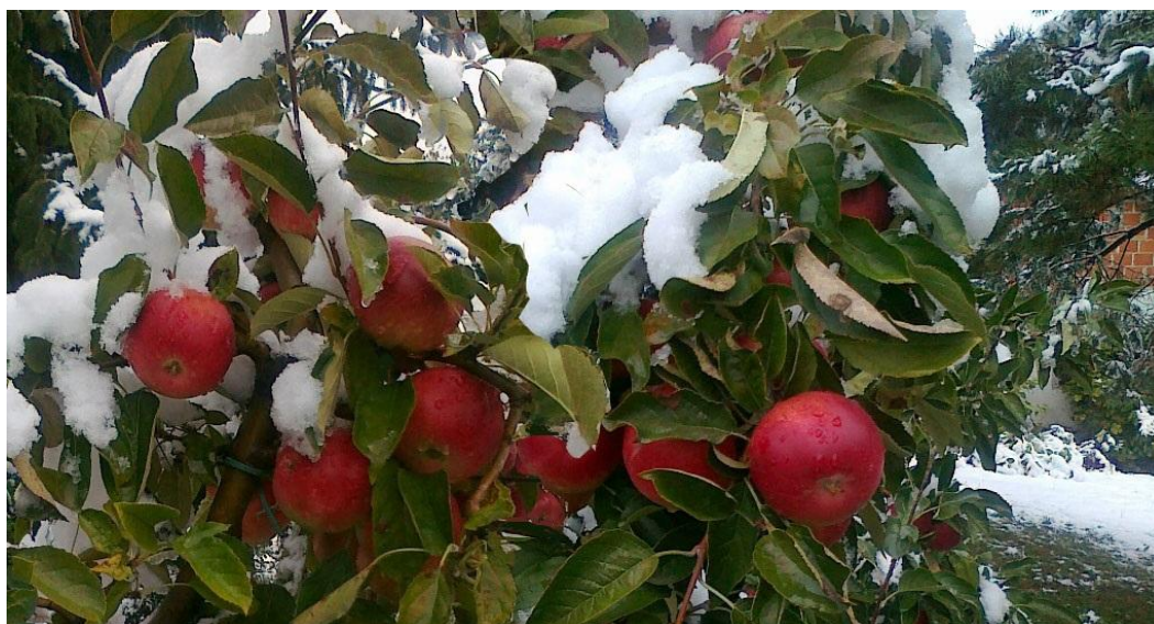
Slika 3. Snijeg pred kraj berbe Idareda u gornjem Međimurju krajem 80-tih

Također, u vinogradima nakon berbe ostane na rozgvi zeleno lišće još i do dva mjeseca, što produžuje potrebu za zaštitom od peronospore, crne pjegavosti, a naročito pepelnice.