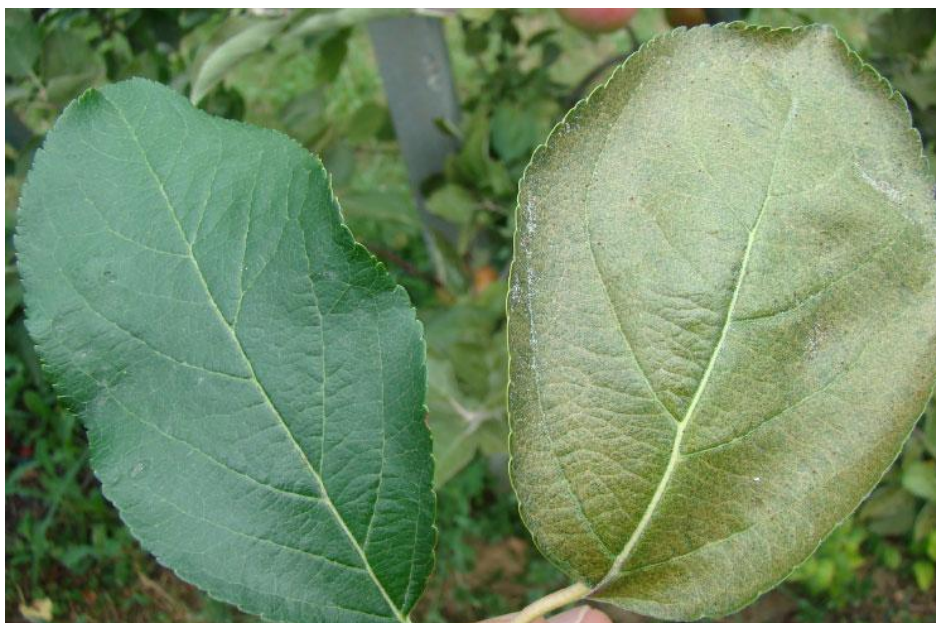
Slika 8. Populacija voćnog crvenog pauka može tijekom ljeta vrlo naglo porasti i do 50 jedinki po listu

Ne postoje samo problemi s fiziologijom voćnih vrsta, već i s biologijom štetnika u voćnim nasadima. Tople i blage zime pogoduju dobrom preživljavanju svih oblika prezimljujućih štetnika. Rano nakupljanje aktivnih temperatura povlači i ranije buđenje štetnika. To znači da je odmah nakon početka vegetacije, već i pred početak cvatnje pritisak insekata i grinja u voćnjacima vrlo velik, zbog čega je potrebno vrlo rano pratiti njihovu prisutnost i brojnost. Visoka temperatura tijekom godine ubrzava metabolizam insekata pa moraju češće jesti i time uzrokovati veću štetu. Osim toga, visoka temperatura potiče i bržu reprodukciju, pa se i njihov broj povećava. Skraćuje se njihov razvojni ciklus, a time se razvija više generacija u sezoni.